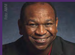
Yassir Eric Communio Messianica