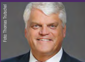
Markus Grübel Beauftragter für Religionsfreiheit, MdB/CDU, Schirmherr und Referent