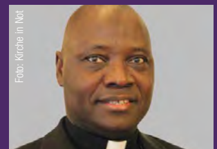
Ignatius Ayau Kaigama Erzbischof von Abuja, Nigeria