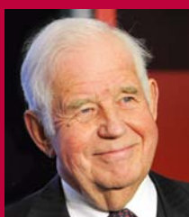
Schirmherrschaft: Professor Dr. Kurt Biedenkopf Sächsischer Ministerpräsident a. D.

Blühende Landschaften – Soziale Herausforderungen